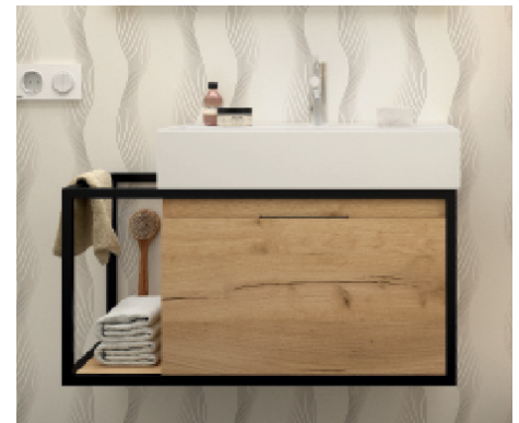
Ensemble structure suspendue + Vasque VENETO 600 porte servietter a gauche